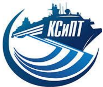
Колледж судостроения и прикладных технологий